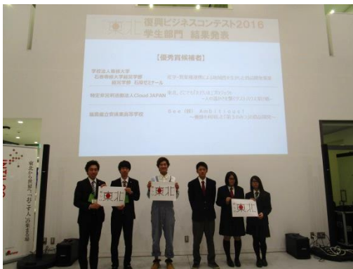
特定非営利活動法人 Cloud JAPAN