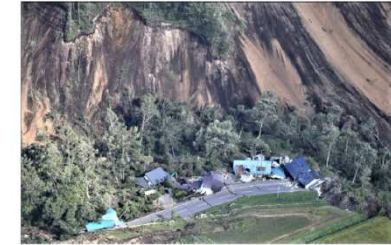
平成30年北海道胆振東部地震