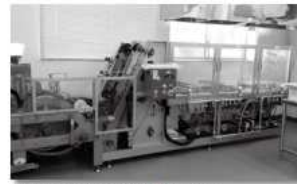
岩手県高田高校に寄贈した竹輪挽機