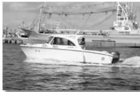
福島県いわき海星高校に寄贈した四級小型実習艇