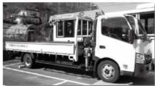
岩手県宮古水産高校に寄贈した小型トラック