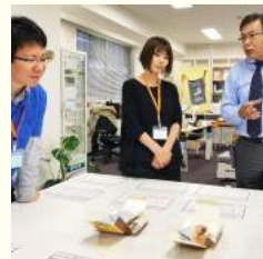
◀ 平成29年度 Fw東北・共創イベントの様子

主催：復興庁 / 企画運営：NECソリューションイノベータ株式会社 (受託事業者)