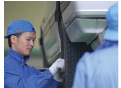
石巻専修大学の学生がタイヤ交換をはじめとする車のメンテナンスに協力。

間関係を築けていることがわかった。カーシェアリング事業が、コミュニティの関係構築に効果を発揮しているのだ。