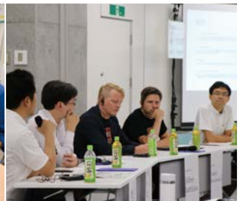
2018年7月には、石巻市内でコミュニティ・カーシェアリングに関するシンポジウムを開催した。