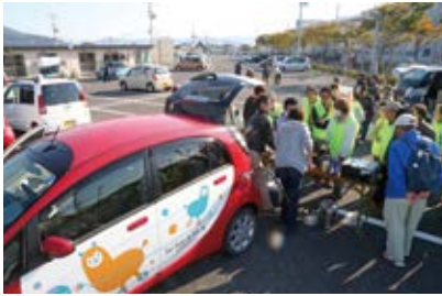
石巻市内の仮設住宅では、EV(電気自動車)を活用した防災訓練も実施。

カーシェアリングを通して被災地支援を行いながら、支え合う地域づくりと新しい車文化の創造を目指している一般社団法人日本カーシェアリング協会(宮城県石巻市)。そうした「コミュニティ・カーシェアリング」の雛形をつくり、その成果をもとに全国の災害被災地域などにも貢献するため、事業の横展開を進めている。