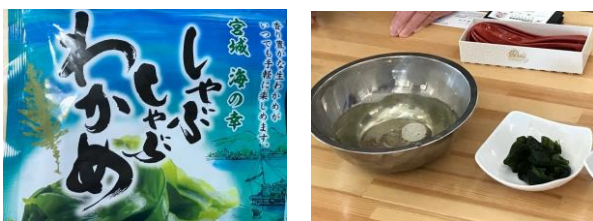
「しゃぶしゃぶわかめ」