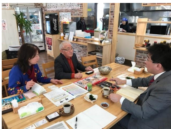
専門家によるアドバイスの様子