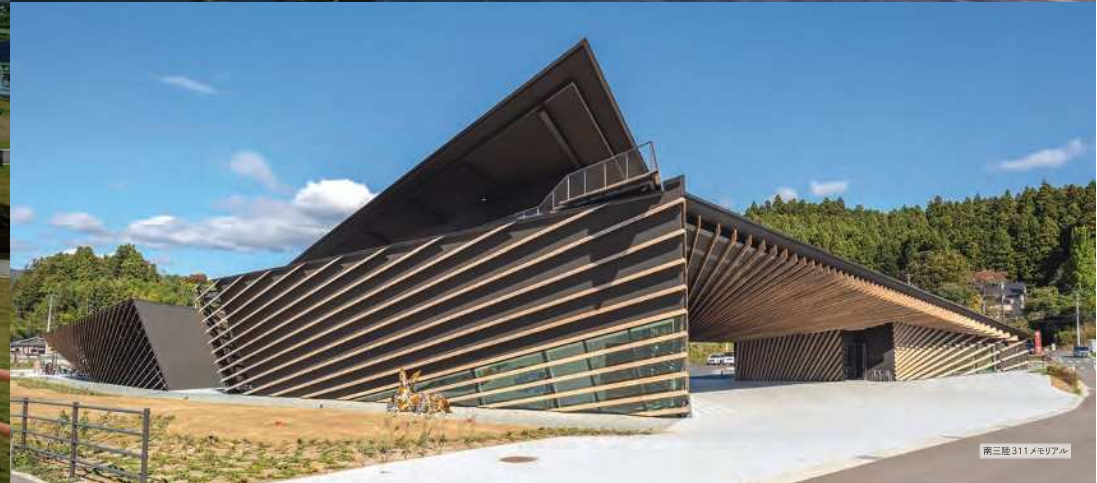
南三陸311メモリアル