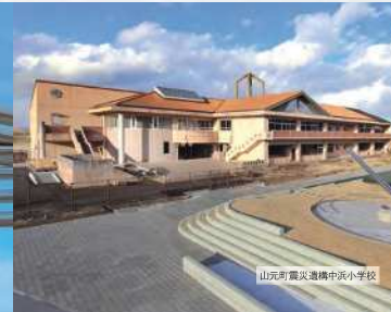
山元町震災遺構中浜小学校