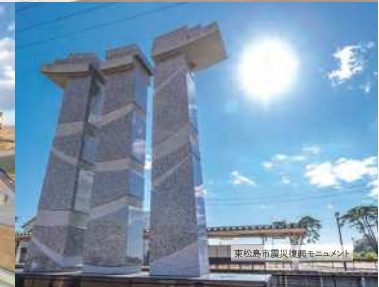
秦野市震災復興記念モニュメント