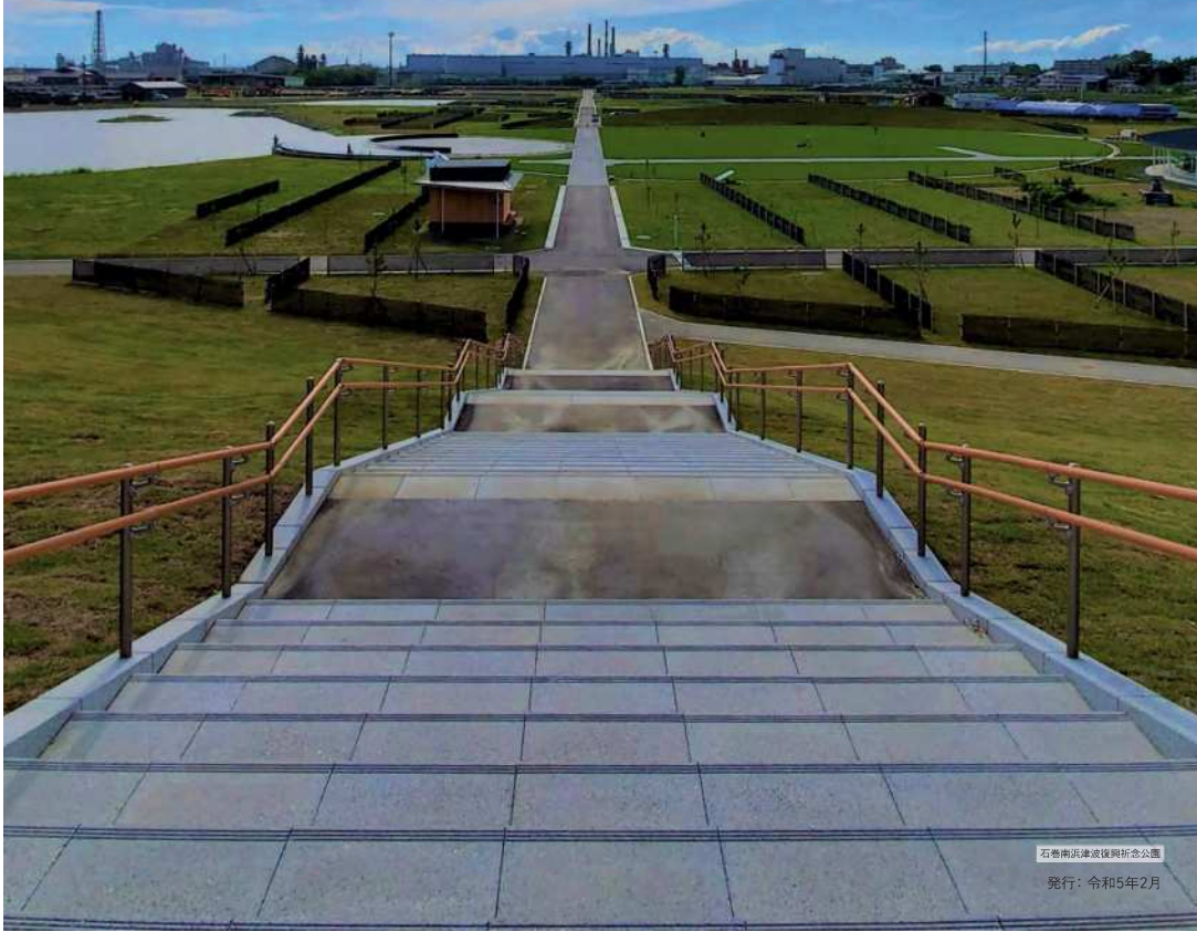
石巻南浜津波復興記念公園 発行: 令和5年2月