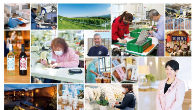
復興庁 産業復興事例集

平成28年2月 「私たちが創る」 平成29年2月 「東北発 私たちの挑戦」 平成30年2月 「続く挑戦 つなぐ未来へ」 平成31年2月 「想いを受け継ぐ次代の萌芽」 令和2年2月 「持続可能な未来のために」 令和3年2月 「復興のその先へ」 令和3年12月 「第二章、始動～ニッポンの次世代モデルを目指す」