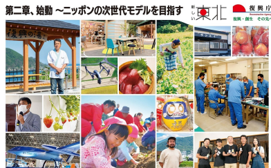
岩手・宮城・福島の 産業復興事例集 30 2021-2022