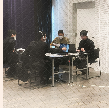
ワークショップの様子 (オンライン形式)