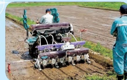
▲農業再生への支援