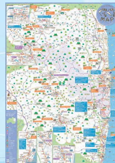
▲「ぐるぐるマップ」の発行