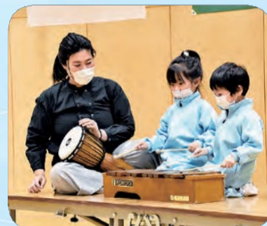
▲五感を刺激する音楽ワークショップ

サテライトの支援活動 地域再生を目指し、住民に寄り添ったソフト面の支援を行っています。支援活動は「地域復興・帰還促進支援」「教育環境の整備」「情報発信」からなります。