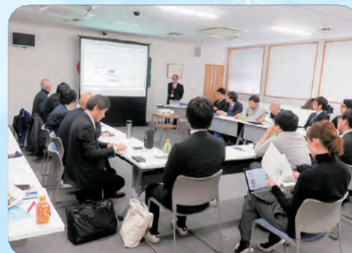
▲役場職員との意見交換会