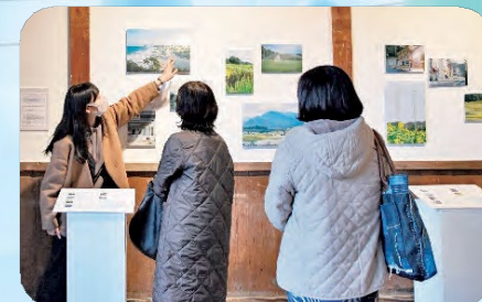
▲県外に向けた被災地情報の発信