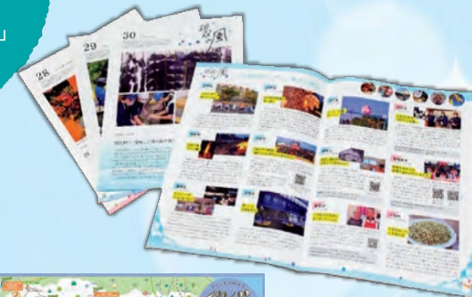
▲被災12市町村の情報を掲載した広報誌「相双の風」

サテライトの支援活動 地域再生を目指し、住民に寄り添ったソフト面の支援を行っています。支援活動は「地域復興・帰還促進支援」「教育環境の整備」「情報発信」からなります。