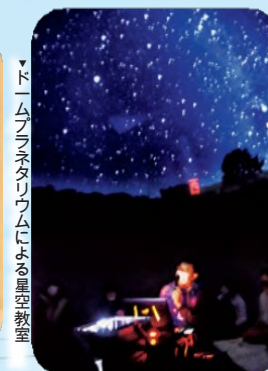
▼ドームプラネタリウムによる星空教室