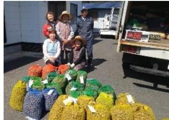
くるみ拾いをさせていただき被災地の方々トラックで回り、買い取る