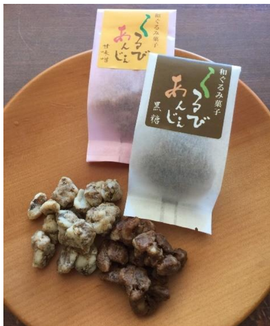
今までになかった和ぐるみのお菓子「くるびあじび」の完成