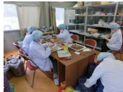
殻むき作業をする被災地の方々 野田村 くる美人