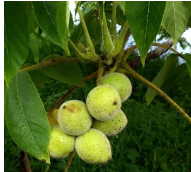
青いくるみが9月には熟して落ちる