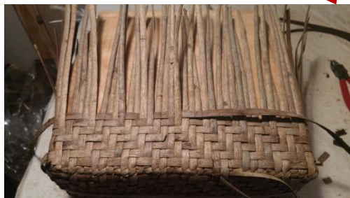
木型にあわせてヒゴを編む