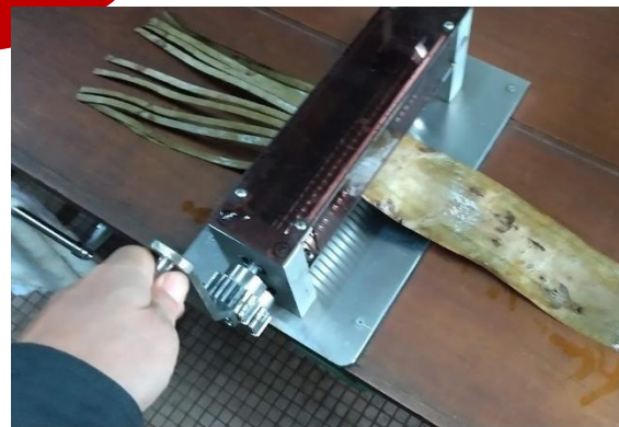
水に浸して柔らかくしてから 裁断機でヒゴを作る