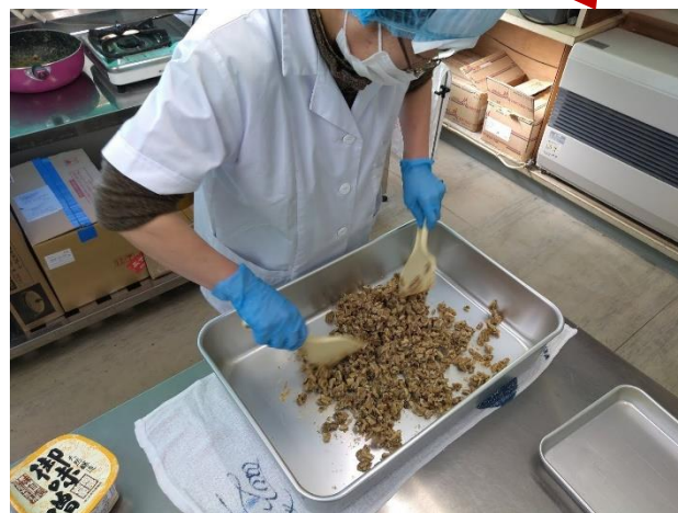
むき実のなかから異物をより分け、大粒だけを選別しお菓子を作る。盛岡に移住した被災者