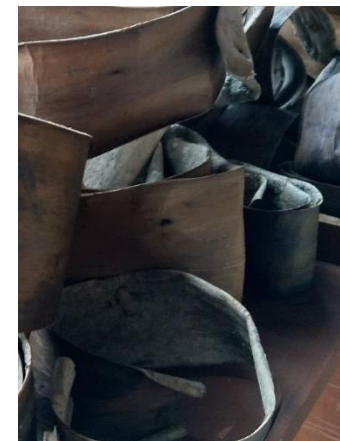
樹皮は丸めて 乾燥し保管