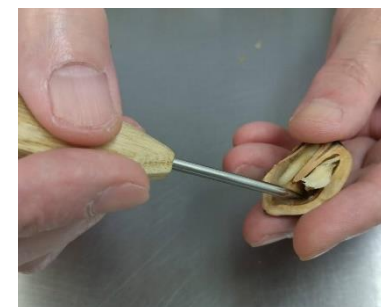
一粒一粒、堅い殻を金槌で叩いて割り、千枚通しで中身をほじくり出す。根気のいる手作業