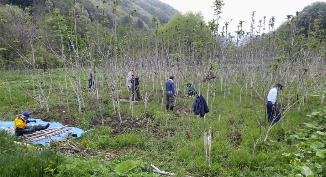
盛岡市の郊外で3500本のくるみを栽培。来年は1万本の苗を植える計画。川原や湖畔、道路脇のくるみも利用している