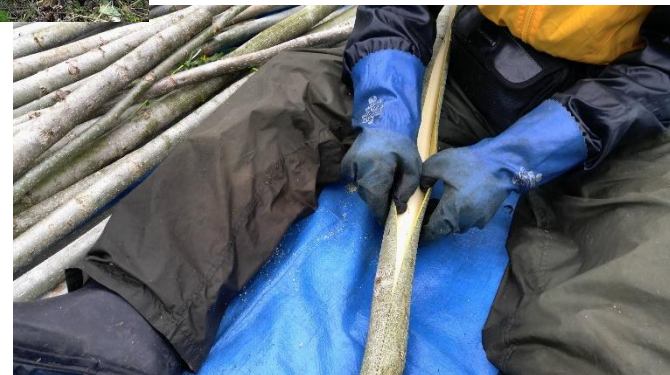
5月～6月、くるみの樹皮は面白くようにつるっとむける