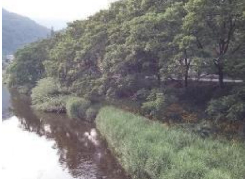
岩手には至る所でくるみの群落が見られる