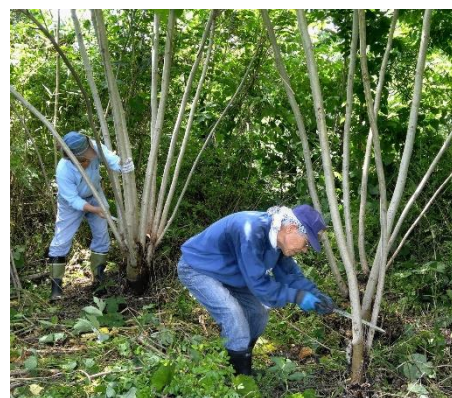
若い木を切る。太さ3.5cm前後の細い幹や枝