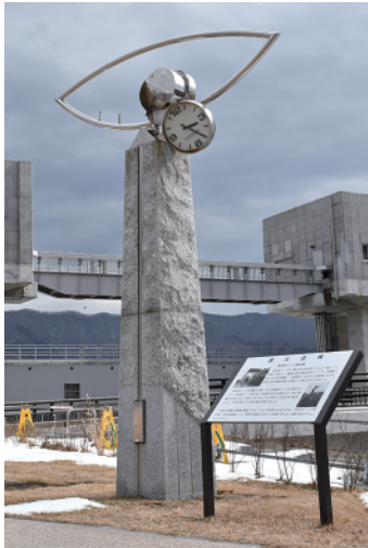
茶茶丸パーク時計塔

「夢海公園」は、平成 31 年 4 月に供用が開始され、公園敷地内には、被災した「茶茶丸パーク時計塔」が震災遺構として保存されています。