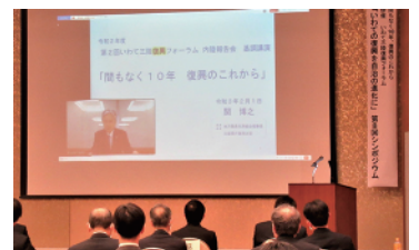
関氏による基調講演の様子

震災から間もなく 10 年、これまでの復興の歩みを振り返り、より良い復興（ビルド・バック・ベター）に思いを寄せる機会となりました。