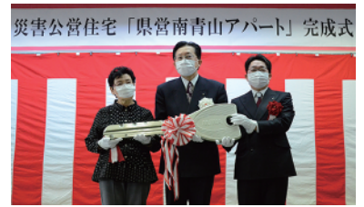
入居者代表への特大キー贈呈の様子

県では、3月中に、応急仮設住宅に住んでいる全ての方々が恒久的な住宅に移る見通しとなりました。