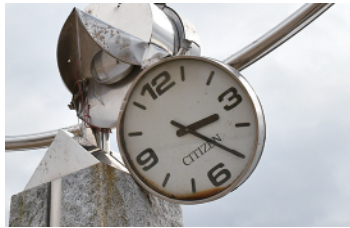
止まったままの時計