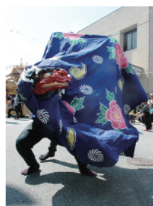
吉里吉里大神楽の演舞