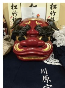
吉里吉里大神楽 の獅子頭

震災後は多くの支援を受けて活動してきましたが、年々地域の子どもたちも減少する中、郷土芸能の伝承を心配しています。吉里吉里には、神楽、虎舞、鹿踊りと3つの郷土芸能があり、小中一貫教育校吉里吉里学園では、小学4年生から中学3年生までの全生徒が参加し、「ふるさと科」という授業として郷土芸能を学んでいますので、私たちが協力を惜みず、ともに伝承活動を続けていきます。