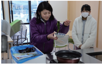
食体験コーナーの様子

「えんやあどっと」では、水産加工体験をはじめ、漁師の食体験コーナーや海産物の展示販売も手掛けており、今後、漁業の担い手育成の拠点としても活用していきます。